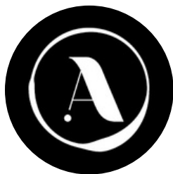
TABLE TERROIR & FROMAGES